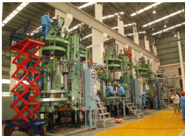
液压硫化机组装现场

轮胎定型硫化机是汽车外胎硫化专用设备，可用于各种普通轮胎和子午线轮胎的硫化。机器具备从装胎、合膜、卸胎及后充气的全过程自动化生产能力，亦可实现手动操作。结合日本神钢新技术生产的硫化机，结构先进，质量可靠。电气采用 PLC 控制，可靠度高，维修、更换硫化规格方便。