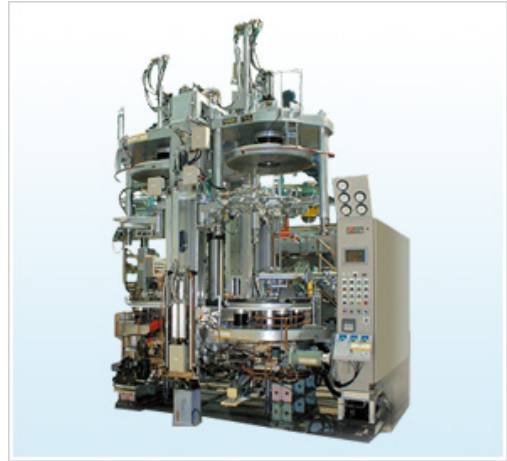
液压式轮胎硫化机