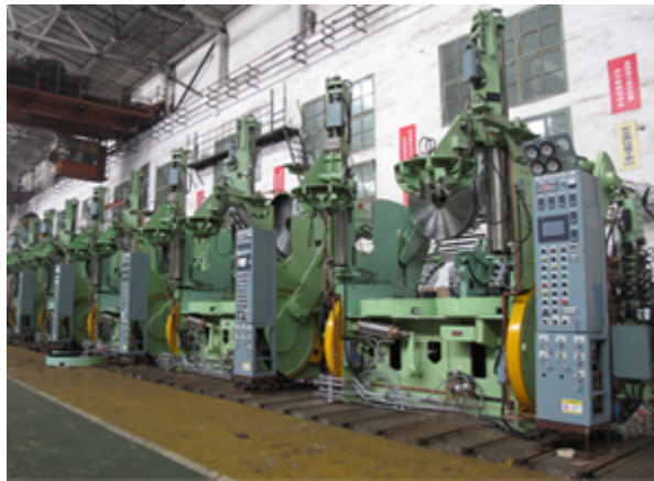
机械式硫化机组装现场